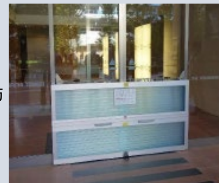
▲エントランスの止水版